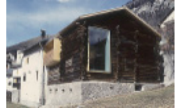
Umbau Ardez Beat Consoni