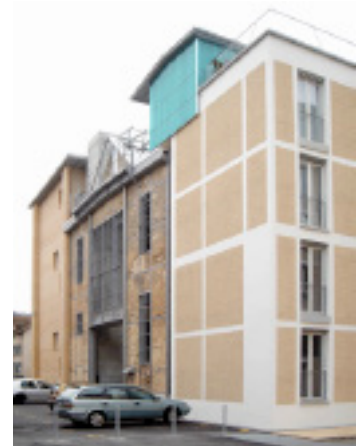
Lokomotive Winterthur Knapkiewicz & Fickert